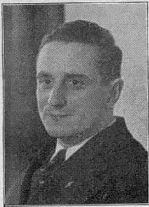
Der Leiter der Abteilung II Garnatz D 4 auf DE 1263