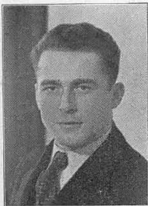
Der Leiter der Abteilung IV Queck D 4 auf DE 0757