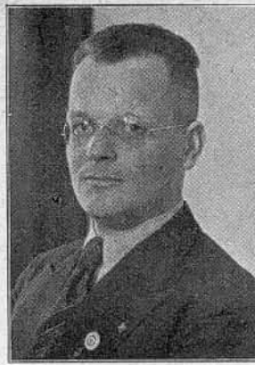
Der Stellvertreter des Präsidenten und Leiter der Abteilung I von Bülow