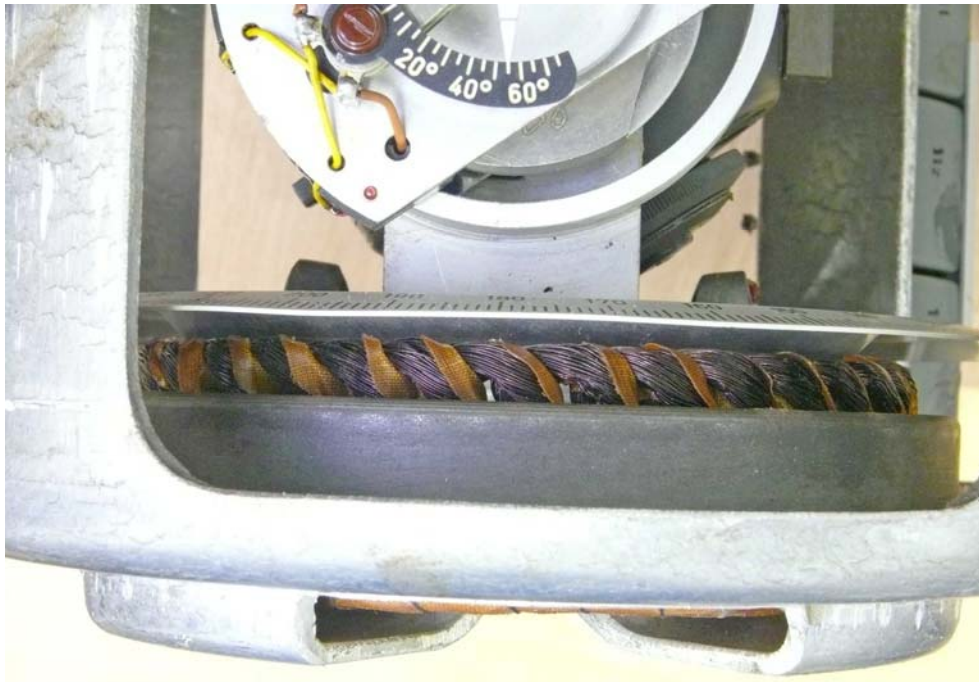
Onderin de torque motor