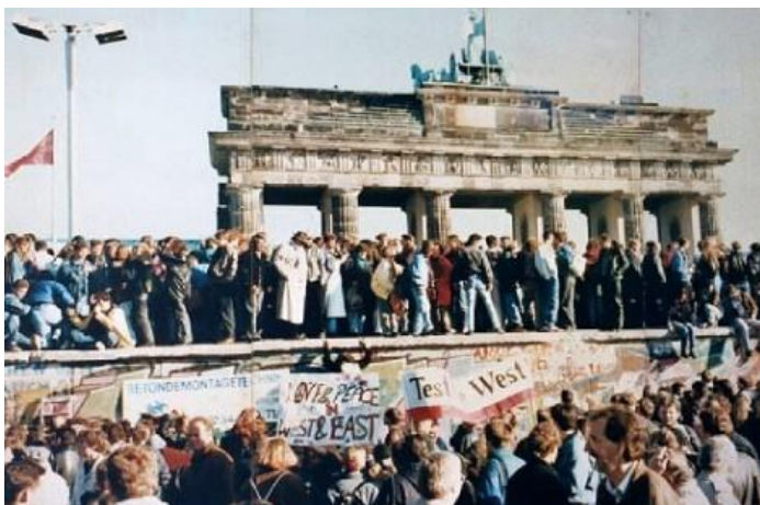
Afbeelding: val Berlijnse muur

'Men kan bewondering hebben voor de veldmedewerkers, de tientallen mannen en vrouwen die -soms jarenlang- belangeloos hun tijd en energie daartoe hebben ingezet. Bewondering ook voor het feit dat men, staven en veldmedewerkers, in staat is geweest de organisatie zo lang geheim te houden.' 68