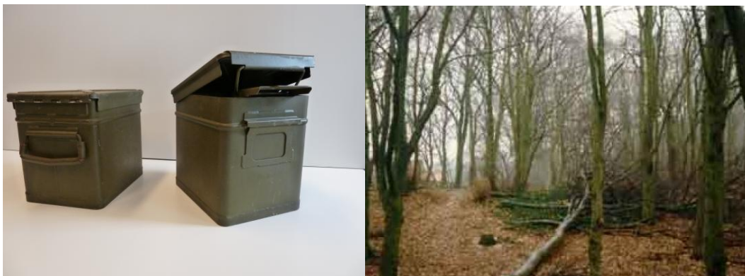
Afbeelding: containers en caches in de bossen

Engelen stelt in zijn rapport vast dat er in 1988 al 39 geheime bergplaatsen, caches genoemd waren voorbereid. Deze bergplaatsen bevatten wapens, sabotagemateriaal, gecodeerde gegevens, verbindingapparatuur en zendplannen. Daarnaast waren er nog 15 geheime bergplaatsen waar waardemiddelen lagen opgeslagen, contanten, gouden munten en edelstenen. 54 Voor 1980 vond het aanleggen van deze caches plaats door eigen medewerkers van de staf. Een zeer zwaar nachtelijk werk, bij voorkeur onder slechte weersomstandigheden wanneer de kans op pottenkijkers klein was. Een en ander trok een zware wissel op de mensen. Gat en graven, met containers slepen en daarna de boel weer camoufleren was een titanenklus. De auteur van deze scriptie heeft dit uit eigen ervaring vastgesteld. Sommige agenten werden na hun voltooide opleiding nog enkele maanden geschoold in het beheer van zo’n geheime bergplaats.