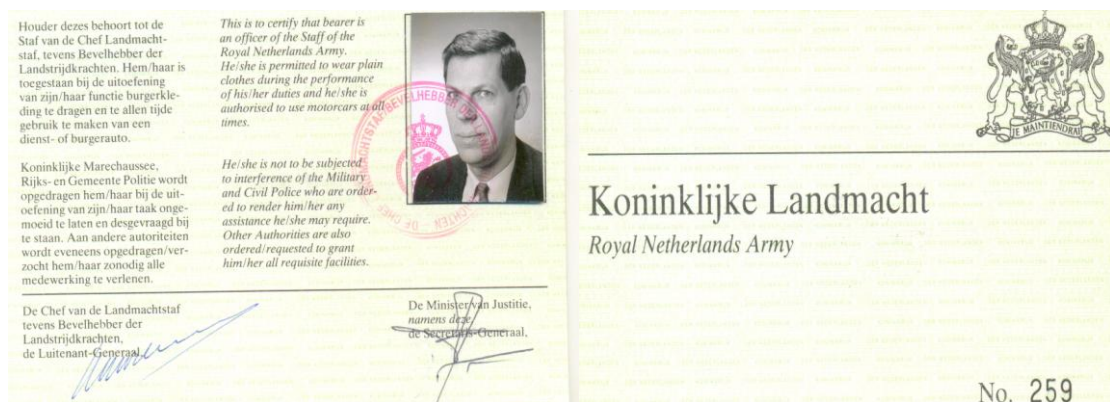
Afbeelding: "de groene pas"

De stafmedewerkers reisden over grote afstanden door heel Nederland naar bijeenkomsten met collega's of agenten, vaak met oefenmateriaal en uitrusting, per openbaar vervoer of bij nacht en ontij met eigen vervoer. Voor eventuele rugdekking bij calamiteiten, bijvoorbeeld een aanrijding of een politiecontrole, beschikte de medewerker over een speciale pas met pasfoto, "de groene pas".