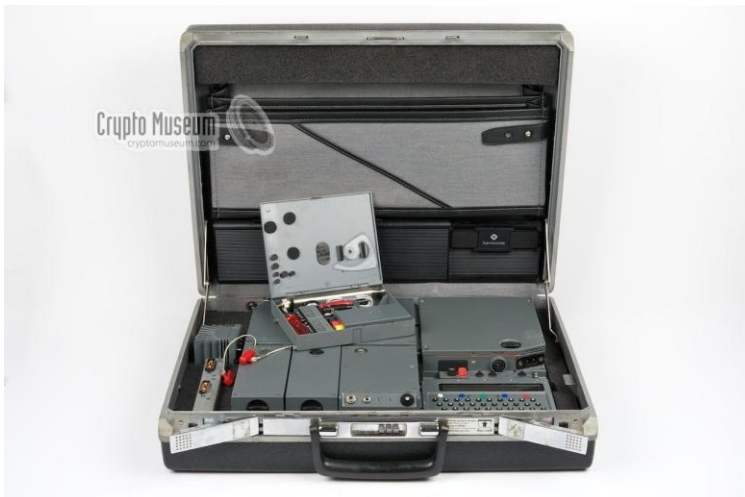
Afbeelding: AZO apparatuur

Deze apparatuur maakte het mogelijk dat iemand die een toetsenbord van een computer kon bedienen, na uiteraard de nodige instructie, met een dergelijk apparaat overweg kon. Het langdurig oefenen met morse werd overbodig. De taken van operator en organisator konden worden gecombineerd, ze werden tot single agent gevormd.