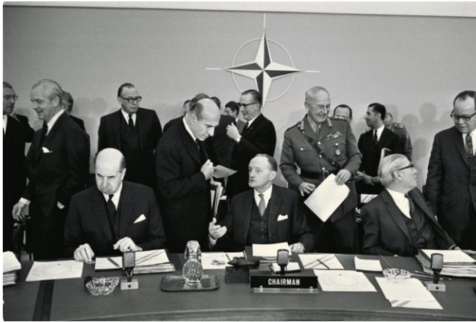
Afbeelding: NAVO vergadering 1949

Amerikanen overhalen om zich erbij aan te sluiten. 71 Het resultaat van de inspanningen was de realisatie in 1949 van de Noord-Atlantische Verdragsorganisatie (NAVO), een militair verdrag dat wederzijdse verdediging en samenwerking van westerse legers regelt. Een aanval (van de Sovjets) op één wordt beschouwd als een aanval op allen. De Verenigde Staten waren een belangrijk lid van de NAVO.