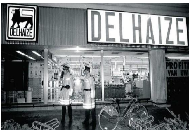
Afbeelding: “De bende van Nijvel” aanslag in België 1985

In 1985 schoot in België, een gewapende bende “De Bende van Nijvel” in Brabantse supermarkten 28 winkelende burgers neer, velen raakten gewond. Onderzoekers leggen een link naar de Belgische organisatie die onder de naam SDRA8 opereerde. Ook het Amerikaanse Defence Intelligence Agency zou erbij betrokken zijn.