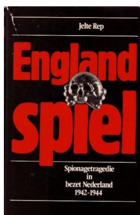
Afbeelding: boek Englandspiel auteur Jelte Rep

Al in 1946 speelden enkele Nederlanders met de gedachte om lessen uit de bezetting van Nederland ter harte te nemen. In overleg met minister-president Schermerhorn werden er plannen gemaakt om in het geheim een organisatie tot stand te brengen, die ingeval van een eventuele bezetting de ruggengraat zou kunnen vormen van burgerlijk verzet in Nederland. 6 De bittere ervaringen die tijdens de voorafgaande bezetting waren opgedaan hadden indruk gemaakt. Er was direct na de overrompeling van het naïeve Nederland door de Duitsers nauwelijks georganiseerd verzet. In het begin was er enig amateuristisch verzet dat door de Duitsers snel werd opgerold. In een latere fase was er sprake van georganiseerd verzet maar door gebrek aan kennis, materiaal, slechte communicatie en verraad zijn veel verzetsstrijders gesneuveld. Ervaring met verzet was er in het al eeuwen neutrale Nederland niet, een mogelijke bezetting was niet voorzien. Een berucht voorval is de spionagetragedie die als Englandspiel 7 bekend staat. In deze scriptie wordt deze affaire nog nader belicht.